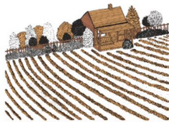
Visions, Caroline du Jour, Caroline du Soir, Vous êtes dans la section B&N