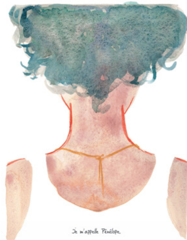
De m'appelle Pénélope