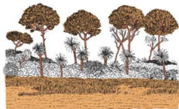
L'air se rechauffe